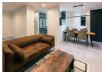
充実の収納スペースと畳コーナー完備の安心子育て設計