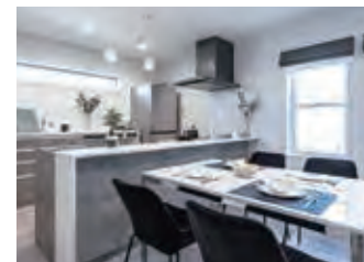
家事楽を意識したLDK。IoTによる連携で各設備品の操作が可能。

【⑤静岡ガスリビング/清水区元城町 物件概要】■所在地/静岡市清水区元城町7-27 ■交通/静岡鉄道静岡清水線「入江町」駅徒歩12分 ■間取/3LDK ■地目/宅地 ■地勢/平坦 ■都市計画/市街化区域 ■用途地域/近隣商業 ■建ぺい率/80% ■容積率/300% ■接道状況/南西公道21m 接道6.7m ■設備等の概要/電気:中部電力 ガス:都市ガス 水道:公営水道 下水:公共下水 ■取引態様/売主 ■取引条件有効期限/令和5年7月31日 ■床面積/101.02㎡(30.55坪) ■土地面積/100.04㎡(30.26坪) ■建物構造/木造軸組工法2階建 ■建物完成年月/令和4年12月完成 ■販売価格(税込)/4,580万円