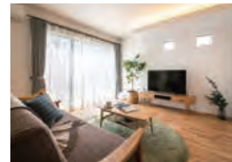
北欧と和モダンをバランスよくミックスしたジャパンディスタイル。*写真はイメージです