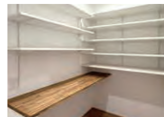
冷蔵庫設置スペースのある、引き戸付の大型パントリー。*写真はイメージです