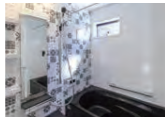
かわいらしい浴室で一日の疲れを癒してください

【④明和住宅/清水区船越 物件概要】■所在地/静岡市清水区船越東町718番17 ■交通/バス停「福祉センター」徒歩約8分 ■地目/宅地 ■都市計画/市街化区域 ■用途地域/第一種中高層住居専用地域 ■建ぺい率/70% ■容積率/180% ■接道状況/東側・南側:約4.5m接道 ■設備等の概要/電気:中部電力 ガス:都市ガス 水道:公営水道、下水:公共下水 ■取引態様/売主 ■取引条件有効期限/令和5年7月31日 ■広告作成年月/令和5年7月4日 ■今回販売戸数/1戸 ■延床面積/114.27㎡(34.56坪) ■土地面積/135.33㎡(40.93坪) ■駐車場/4台可 ■建物構造/木造在来工法2階建 一部モノコック構造 ■建物完成年月/令和4年7月完成 ■確認番号/第R3確認建築静建住ま05523号 ■販売価格(税込)/3,880万円