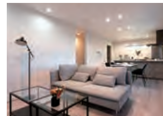
躯体の高性能化を追求。断熱性能を向上させ、エネルギー効率の良い住宅に。