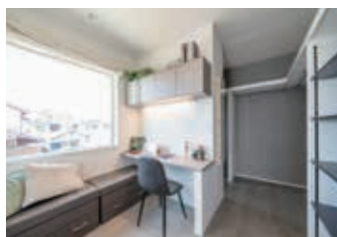
在宅ワークにも使える書斎。ホワイト× グレー×ブラック基調のインテリアです。