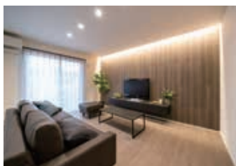
横幅約4.5mの広々リビングで、ホテル ライクなインテリアが魅力です。