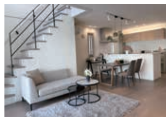
洗面脱衣まで通り抜けできるシューズ インクローゼット