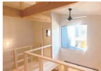
家族の気配を感じ、リビングも明るく 照らす4.5帖の吹抜け