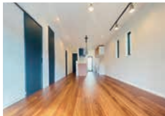
適材適所の収納スペース。 リビング広々18.8帖!