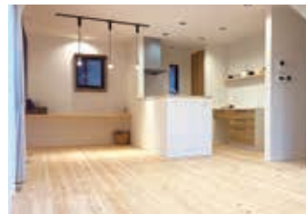
土間とつながり開放感のある20帖の リビングダイニング