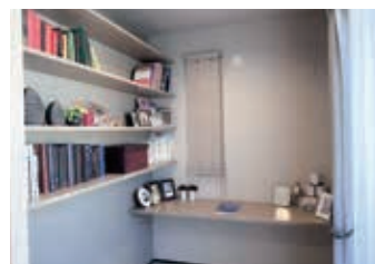
在宅ワークにも使えるセミクローズ な書斎