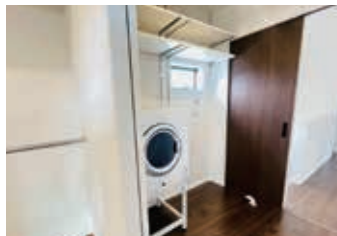
ランドリールームには今、話題の 乾太くん搭載、ご家族思いの家事導線。

【③明和住宅/葵区瀬名 物件概要】■所在地/静岡市葵区瀬名3丁目20番9号 ■交通/バス停「東上」徒歩3分 ■地目/宅地 ■都市計画/市街化区域 ■用途地域/第一種中高層住居専用地域 ■建ぺい率/60% ■容積率/150% ■道路の幅員/約6.48m ■設備等の概要/電気:中部電力 ガス:都市ガス 水道:公営水道、下水:公共下水 ■取引態様/売主 ■取引条件有効期限/令和6年12月末日 ■広告作成年月/令和6年5月20日 ■今回販売戸数/1戸 ■延床面積/106.82㎡(32.31坪) ■土地面積/110.79㎡(33.51坪) ■建物構造/木造在来工法2階建 ■建物完成年月/令和6年6月完成予定 ■建築確認番号/第2023確認建築建住ま05810号 ■販売価格(税込)/3,780万円